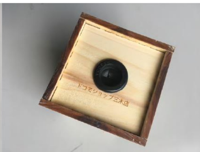
底部：硬貨取出口 ロゴ入り